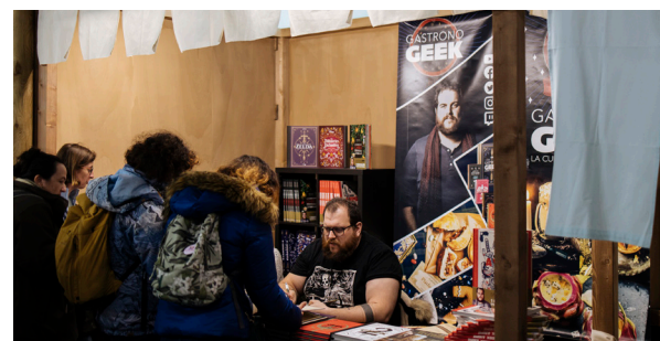
Stand 6 m 2 , sans angle